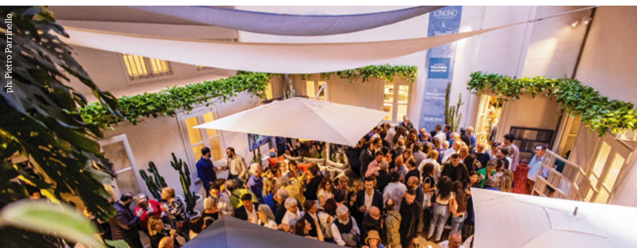
Uno dei cortili di Palazzo Pintacuda

Palermo prima di Milano, Palazzo Pintacuda invece di una fiera. Nella nostra città si è infatti tenuta la prima tappa dell'Outdoor Lab Tour 2023/24, la master class itinerante che mette a confronto didattica e sostenibilità, outdoor e design attraverso la lente d'ingrandimento dell'esperienza di celebri designers ed architetti.