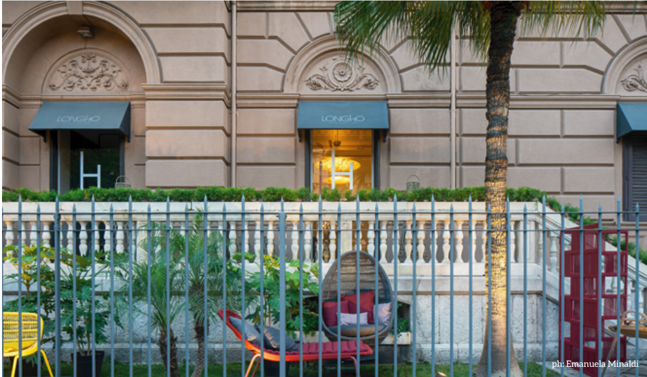
Longho Design Concept Store in via Libertà 42

A Palermo la prima tappa dell'Outdoor Lab Tour 2023/24 by Talenti con la master class di Roberto Palomba.